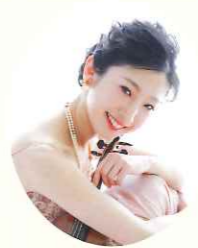
波馬朝加【ヴィオラ】

愛知県立芸術大学音楽学部器楽科首席卒業。現在は、東海地方を中心に様々な演奏活動をしながらか後進の指導にも力を注いでいる。安城学園高等学校非常勤講師、弦楽部コーチ。