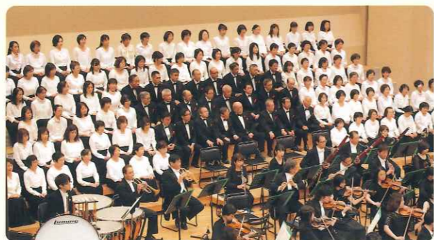
セントラル愛知交響楽団 ワンコインコンサート スペシャル合唱団

名古屋芸術大学大学院首席修了。理事賞、萩原和子賞、岐阜県知事賞、山田貞夫音楽財団音楽賞特選他、受賞多数。国内外のオーケストラと共演。CDを2枚リリース。名古屋芸術大学非常勤講師。