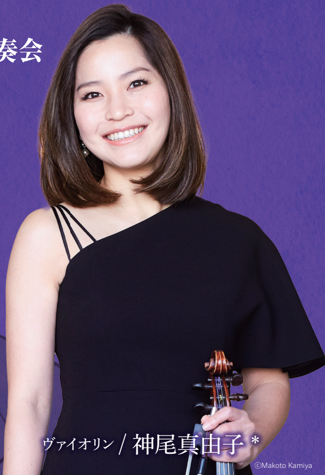
ヴァイオリン / 神尾真由子*