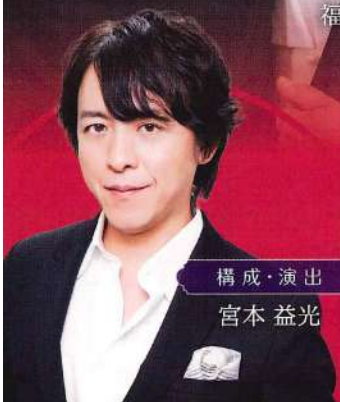
構成・演出 宮本 益光