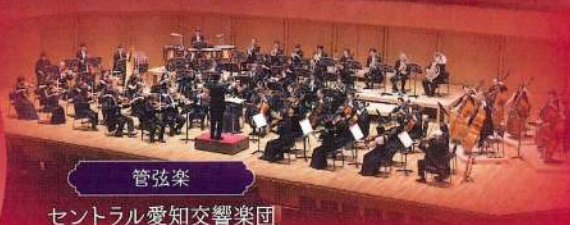
管弦楽 セントラル愛知交響楽団