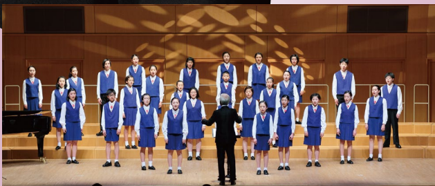
合唱 名古屋少年少女合唱団