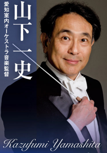
Kazufumi Yamashita ©Ai Ueda