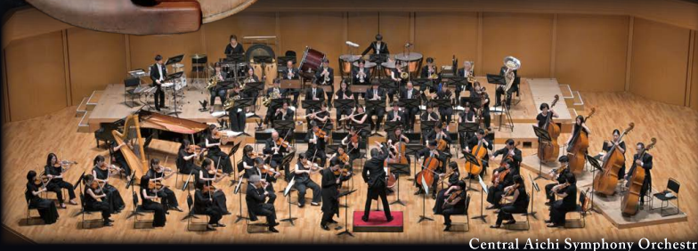
Central Aichi Symphony Orchestra

・愛知芸術文化センタープレイガイド TEL 052-972-0430 ・チケットぴあ https://t.pia.jp/ Pコード[318-916]